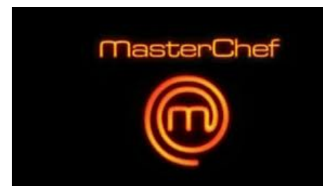
Les 2 finalistes de la prochaine émission