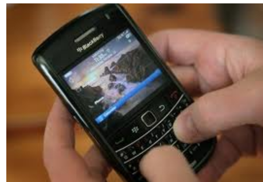
Des photos privées de stars ...