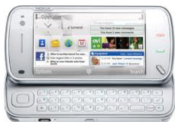
La photo du dernier prototype High Tech