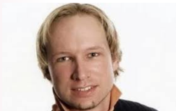
La haine avant le passage à l'acte