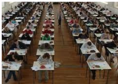
Les sujets du BAC 2011