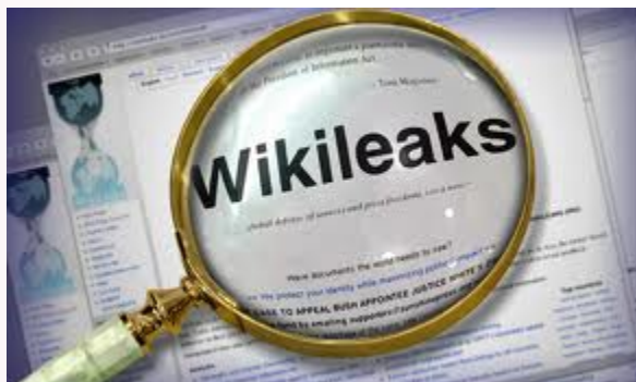
Les notes diplomatiques