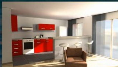
A son domicile