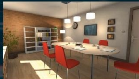
A l'hôtel et pendant la présentation