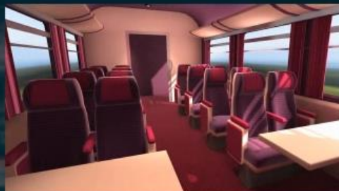
Dans un train